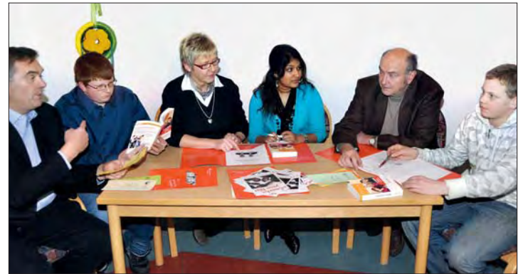
Coaches im Gespräch mit Jugendlichen.

Sie verfügen über einen hohen Schatz an Lebens- und Berufserfahrung und haben Freude am Umgang mit Jugendlichen. Im Jahr 2009 wurden 75 Jugendliche betreut. Die Jugendlichen sind zum größten Teil Schüler der Hauptschulen aus Ibbenbüren und der nahen Umgebung. Sie nehmen freiwillig die Unterstützung des Coaches an. Ihre Lehrer und auch die Eltern befürworten diese intensive Form der Einzelbetreuung. Jugendliche schätzen die Verlässlichkeit eines Erwachsenen, der sich uneigennützig und unentgeltlich, immer nur auf beiderseitiger Freiwilligkeit der Zusammenarbeit, dem Jugendlichen zuwendet. Die Intensität dieser Beziehung außerhalb der gewohnten gesellschaftlichen und schulischen Strukturen ermöglicht es Jugendlichen, sich auf diese Form der Hilfe einzulassen.