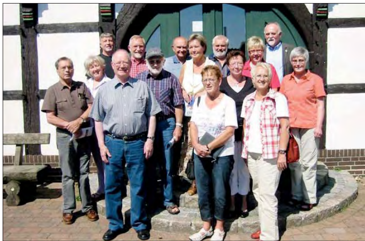
Coaches besuchen die Ledder Werkstätten und informieren sich über Ausbildungsmöglichkeiten für Jugendliche.

einrichtungen und beteiligten Behörden. Sie akquiriert auch die Coaches und betreut diese. Sie stellt den Kontakt zwischen den betreuten Jugendlichen und den Coaches her. Die Projektleitung ist im Zusammenwirken mit den Coaches verantwortlich für den Erfolgsnachweis, die Evaluation. Die Coaches in diesem Projekt sind ehrenamtlich tätige Männer und Frauen. Aktiv sind derzeit rd. 35 Coaches. Sie kommen aus verschiedenen Berufsgruppen, z. B.: Ingenieure, Handwerksmeister, Kaufleute, Heilberufler, Beamte, Lehrer, Sozialarbeiter, Banker, kaufmännische Angestellte. Der Großteil der ehrenamtlich Tätigen ist im Ruhestand.